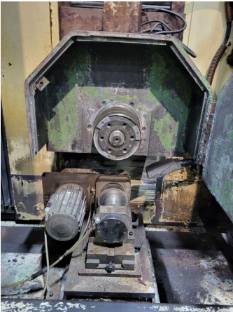
Grinding Disc Housing Open