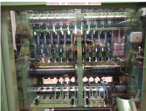
Tool area back