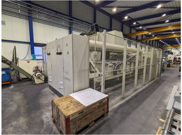
WZ Wechsler Aussen