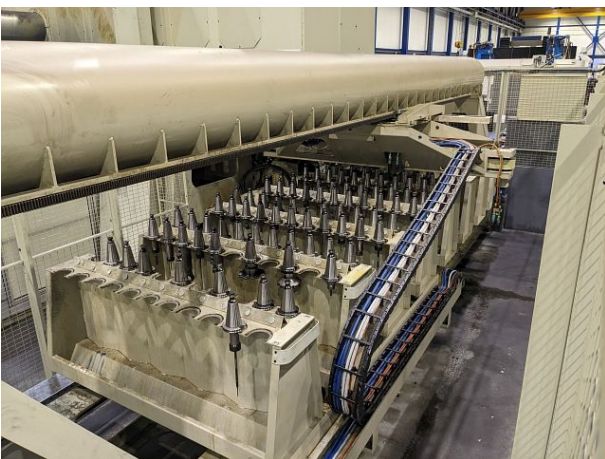
WZ Wechsler Magazin