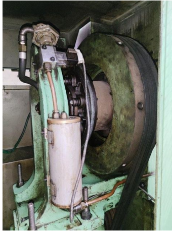
Clutch and flywheel