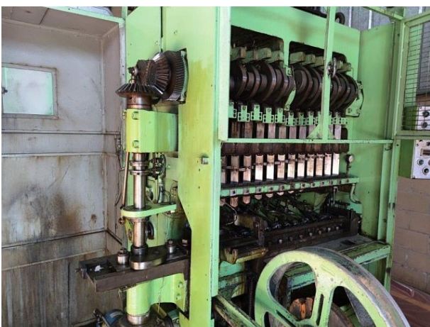
Side shaft and front