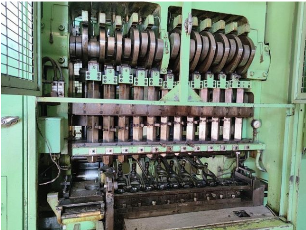
tool and cams